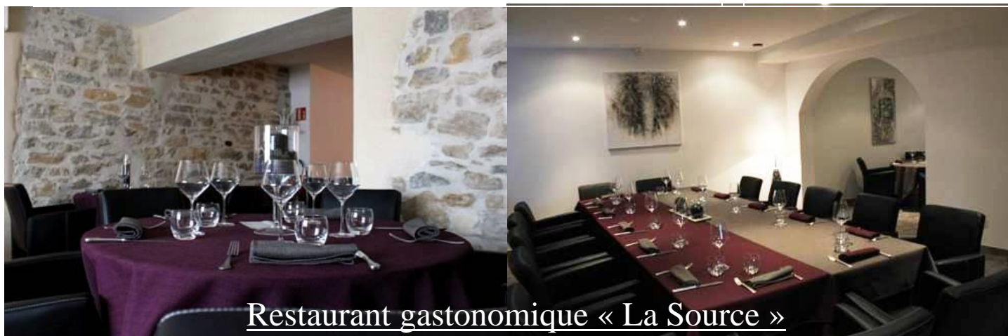
Restaurant gastronomique « La Source »

La ville de Lagnieu occupe une position privilégiée. Elle se situe à 7 km d'Ambérieu en Bugey, 37 km au Sud de Bourg-en-Bresse (chef-lieu de département de l'Ain), à 40 km de l'aéroport Lyon-Saint-Exupéry, 50 km de Lyon, 111 km de Genève et 140 km de Valence.